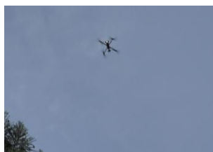
飛行状態のドローン